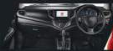
MODERN INSTRUMENT PANEL PANEL INSTRUMEN ERGONOMIS YANG MODERN

INTERIOR BALENO TERASA LAPANG DENGAN SENTUHAN DESAIN MODERN BERKUALITAS TINGGI YANG FUNGSIONAL NAMUN TETAP BERKELAS.