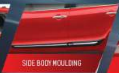
SIDE BODY MouldING