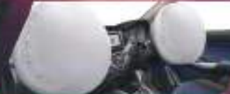
DUAL SRS AIRBAG

AKSESORI PENDUKUNG PADA BALENO DIHADIRKAN UNTUK MENINGKATKAN PENAMPILAN SERTA KENYAMANAN.