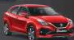
Solid Fire Red