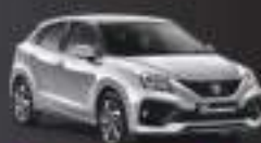
Metallic Premium Silver