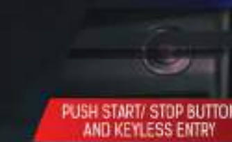
PUSH START/ STOP BUTTON AND KEYLESS ENTRY