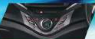
AUTO CLIMATE A/C WITH HEATER