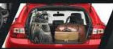
SPACIOUS LUGGAGE CAPACITY KAPASITAS BAGASI YANG LUAS