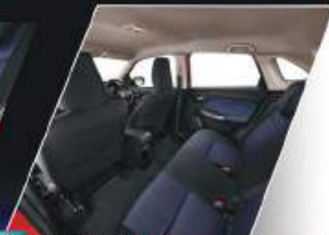
NEW SPACIOUS CABIN WITH NEW SEAT COVERS COLOR AND PATTERN