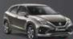
Metallic Magma Gray