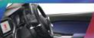
TILT & TELESCOPIC STEERING

BALENO DIDUKUNG FITUR KEAMANAN YANG LENGKAP DENGAN TEKNOLOGI TERKINI.