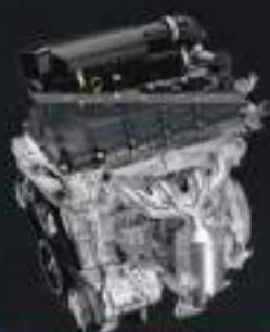
MESIN K 14B, DOHC, VVT, MPI

SEBAGAI THE COMPLETE HATCHBACK, BALENO BERIKAN FITUR-FITUR TERBAIK DI KELASNYA.