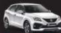
Pearl Arcob White