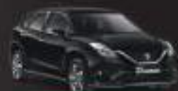
Pearl Midnight Black