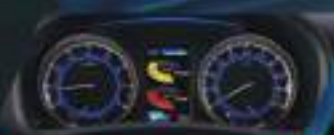
ATTRACTIVE MULTI INFORMATION DISPLAY