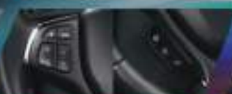
LEATHER STEERING WHEEL WITH SWITCH AUDIO CONTROL AND BLUETOOTH PHONE CONNECTION