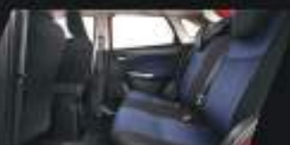
60:40 REAR SEATBACK BERIKAN KEMUDAHAN DAN KENYAMANAN SAAT BUTUH RUANG LEBIH