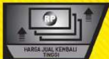
HARGA JUAL KEMBALI TINGGI

Dengan mesin yang bergengsi, semakin untung dengan harga jual kembali yang tinggi.