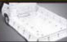
UKURAN BAK LEBIH LUAS

Bawa muatan lebih banyak dengan kapasitas maksimal 1 ton.