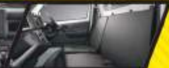
KABIN LEBIH LEGA

Banyak tempat penyimpanan dengan tambahan kompartemen di kabin.