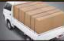
DAYA ANGKUT LEBIH BESAR

Bawa muatan lebih banyak dengan kapasitas maksimal 1 ton.