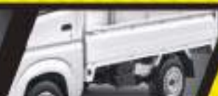
SASIS LEBIH KIMAT

Body kuat & tangguh, Ohang grip dengan pelat baja kabin.