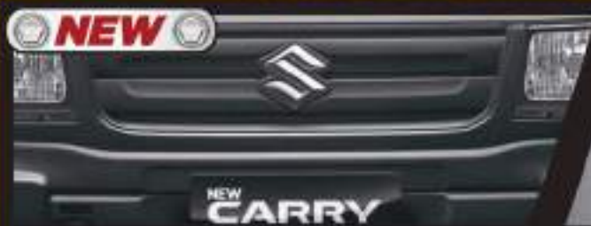
HATCHED AXE FRONT GRILLE

Tangguh dan kuat untuk bawa untung bisnis Anda.