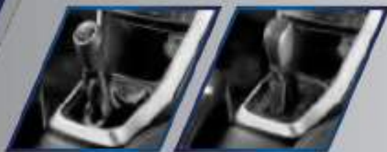
5 MT & 6 AT Transmissions